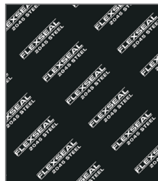
Negro / Negro

Muy buena sellabilidad y propiedades de retención de torque. Diseñado para resistir químicos agresivos, especialmente usados en las industrias químicas, petroquímicas y papeleras.