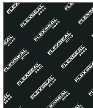
Negro / Negro

Excelente resistencia al vapor y a medios fuertemente alcalinos. Exhibe una muy buena sellabilidad y propiedades de retención de torque. Diseñado para resistir químicos agresivos, especialmente usados en las industrias químicas y petroquímicas.