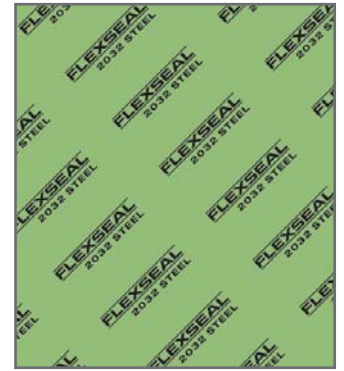
Verde / Verde

Material con propiedades extraordinarias de resistencia mecánica y de temperatura. Apto para hidrocarburos y compuestos químicos de agresividad media. Muy Buen desempeño en vapor.