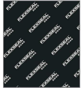
Negro / Negro

Excelente resistencia al vapor y a medios fuertemente alcalinos. Exhibe una muy buena sellabilidad y propiedades de retención de torque. Diseñado para resistir químicos agresivos, especialmente usados en las industrias químicas y petroquímicas.